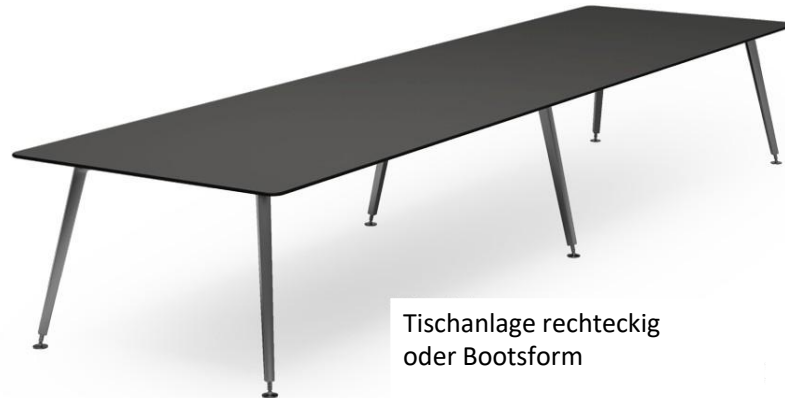
Tischanlage rechteckig oder Bootsform