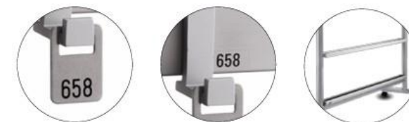
Ausgabemarken Klebenummern Schirmgarnitur